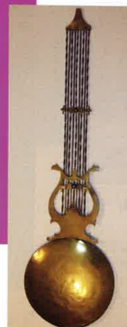
▲ 100 € Pendule ancienne avec son balancier lyre et ses poids. Fonctionne très bien. Sonne les heures. Prévues pour être accrochées au mur.