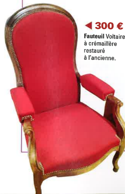
◀ 300 € Fauteuil Voltaire à crémaillère restauré à l'ancienne.