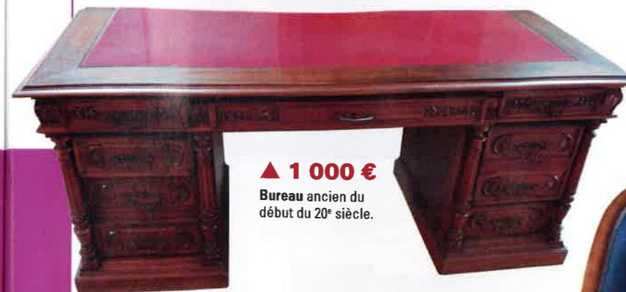
▲ 1 000 € Bureau ancien du début du 20 e siècle.