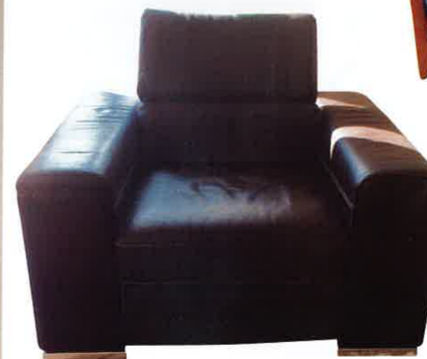
▼ 100 € les deux